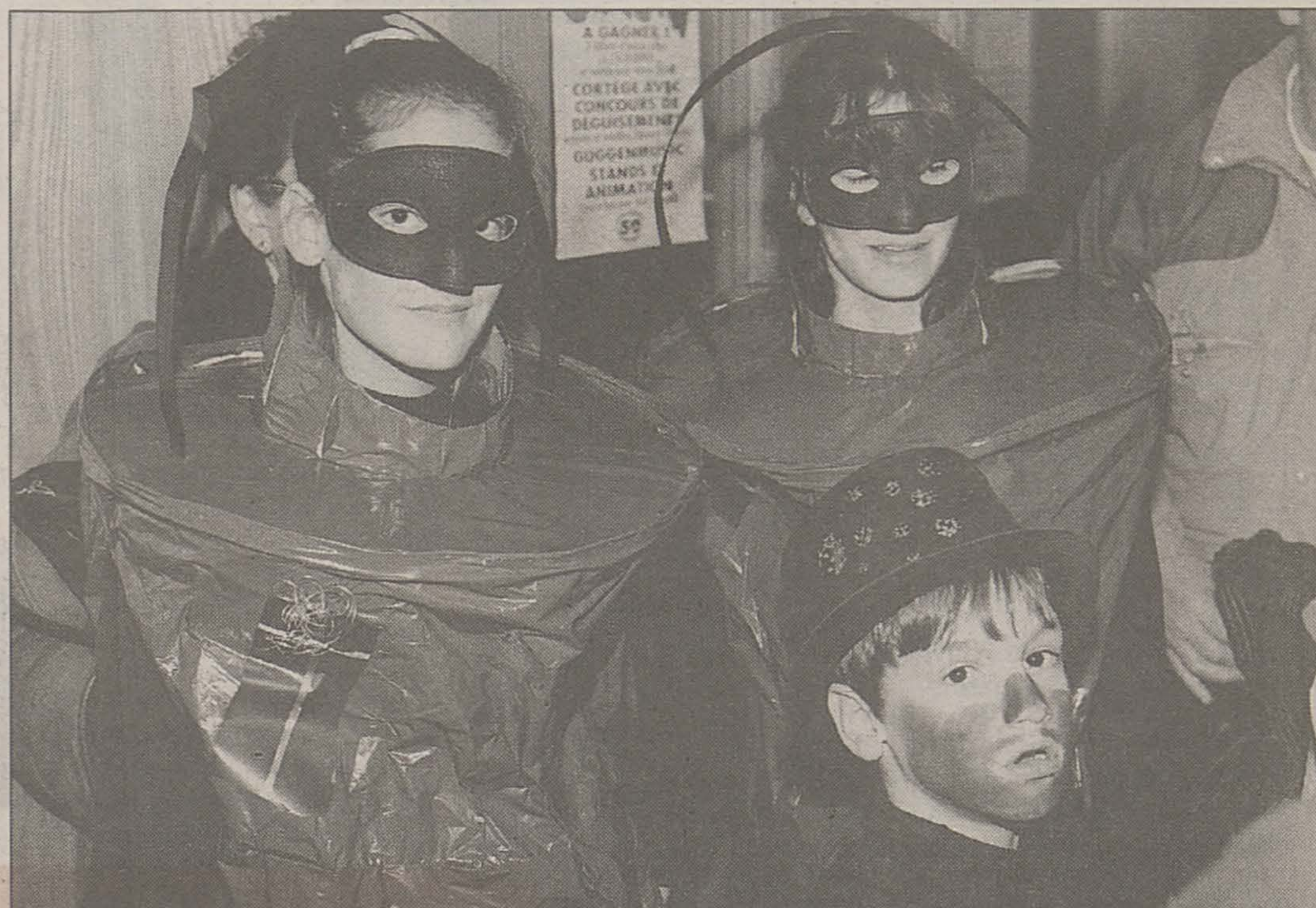
Les Ramoneurs porte-bonheur dans toute leur splendeur.