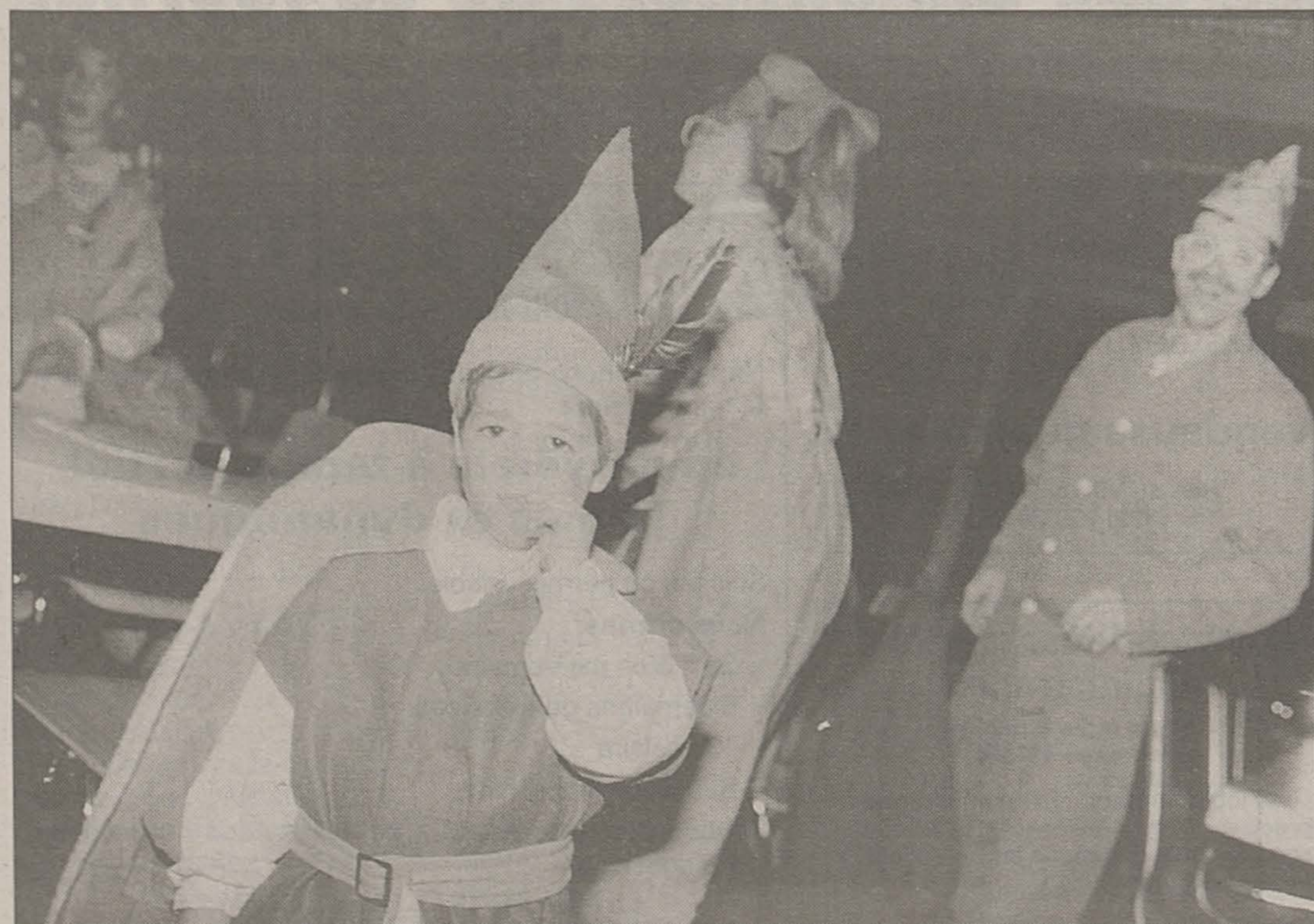
Un participant resté bien songeur face à la photographe.

tumes remporte chaque année moins de succès. A tel point que les organisateurs se demandent s'ils vont poursuivre dans cette voie. Un bal, oui, mais costumé? C'était