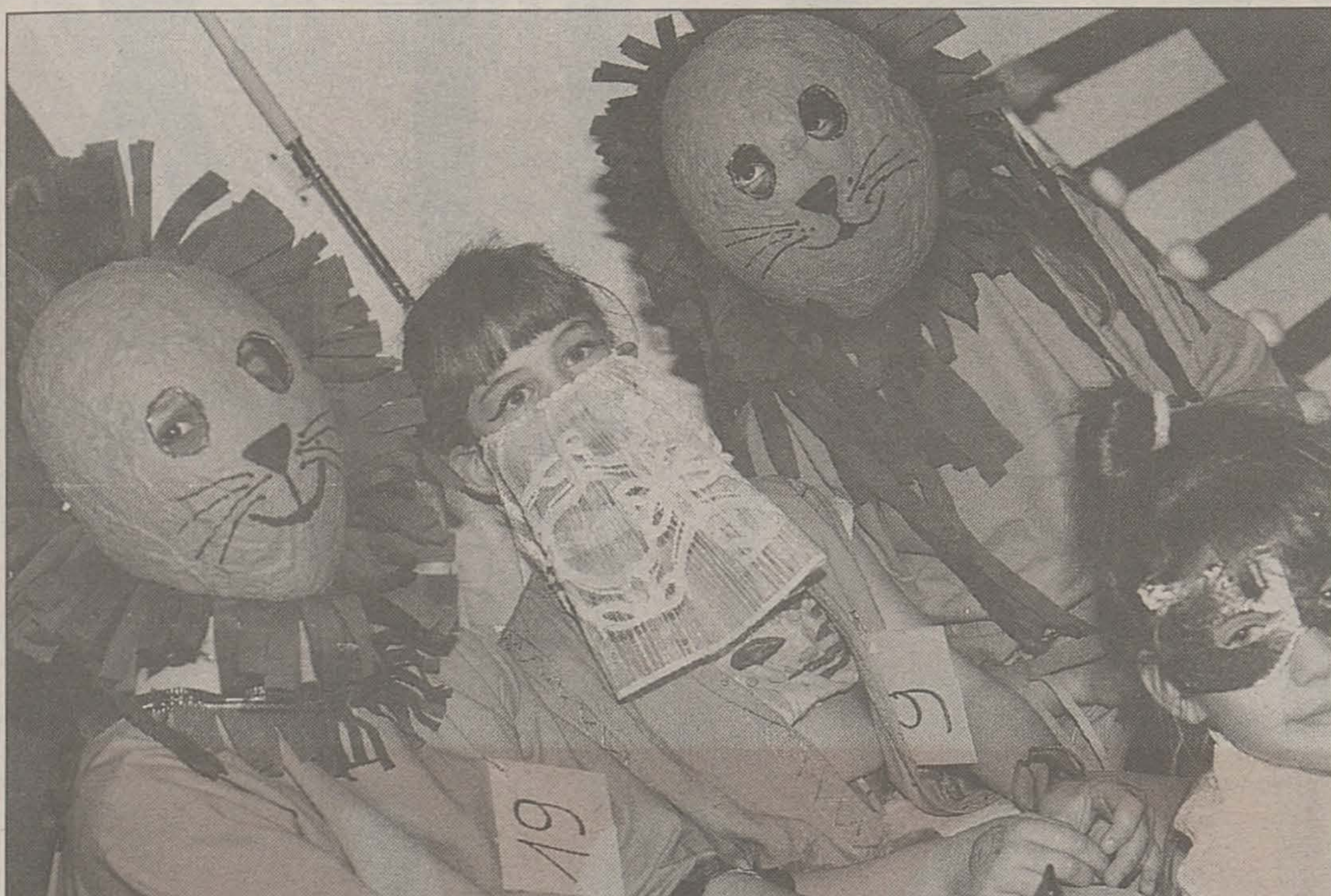
Tout droit descendu de la jungle (et aussi un peu inspiré par Walt Disney sans doute), voici Le Roi Lion.